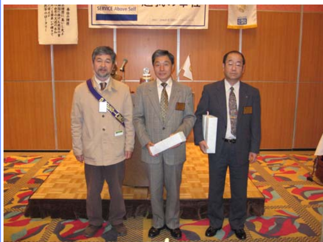
井田会員、小須田会員 おめでとうございます！